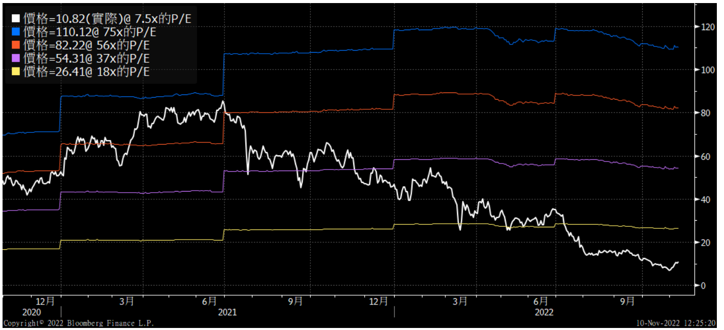
图 1: 碧桂园服务 PE Band