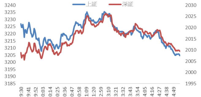
Figure 2: 上证及深证指数走势图