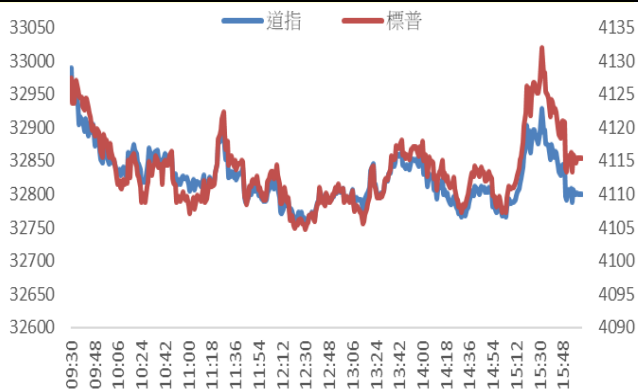
Figure 4: 道琼斯指数及标普 500 指数走势图