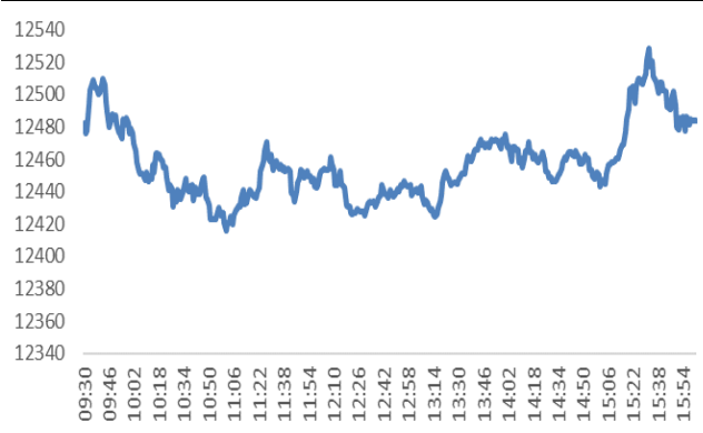
Figure 5: 纳斯达克指数走势图