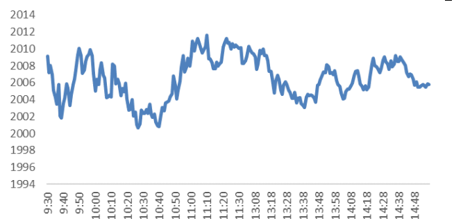
Figure 3: 内地创业板指数走势图