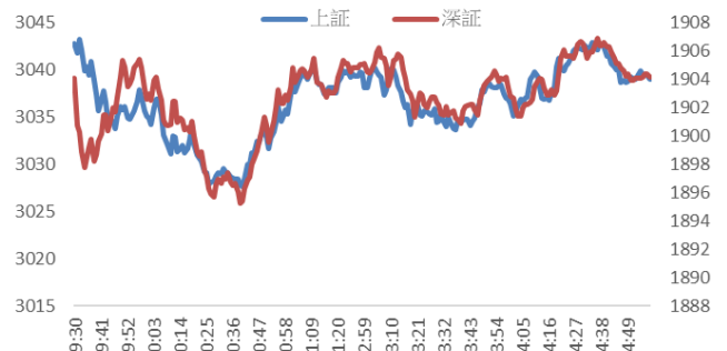
Figure 2: 上证及深证指数走势图