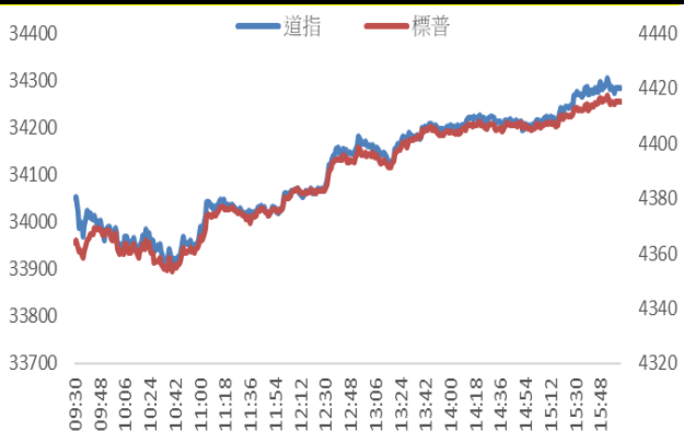
Figure 4: 道琼斯指数及标普 500 指数走势图